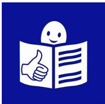
Logo tekstu łatwego do czytania i zrozumienia

Wojewódzki Urząd Ochrony Zabytków w Toruniu to w skrócie Urząd.